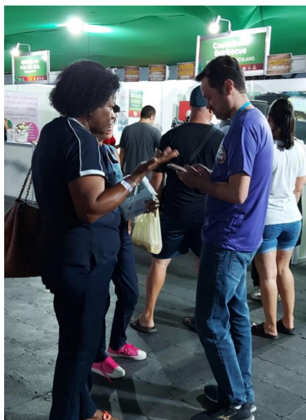
Realização da pesquisa de campo

Durante a 38ª Festa da Uva de Jundiaí – evento anual que reúne mais de 200 mil pessoas durante quatro finais de semana – a Secretaria de Turismo e Viagens do Estado de São Paulo (SETUR-SP) realiza uma pesquisa de campo para conhecer o perfil do público do evento. Os questionários são conduzidos pelo Centro de Inteligência da Economia do Turismo (CIET), juntamente com o Departamento de Fomento ao Turismo e a Unidade Adjunta de Governo do município de Jundiaí.