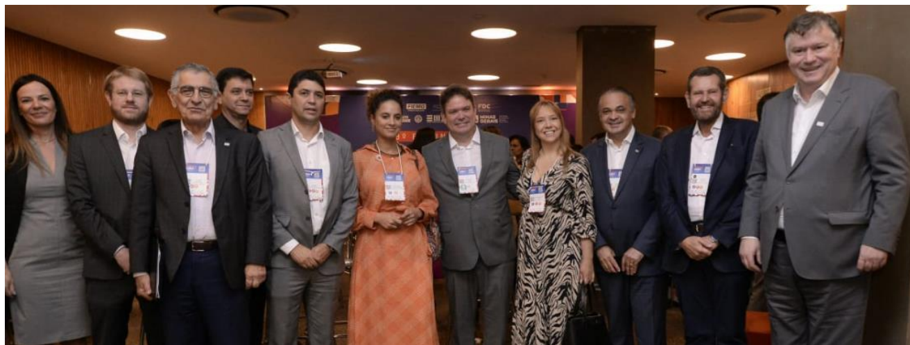
Representantes do turismo dos estados do COSUD encontram-se em Belo Horizonte

Para ler a matéria na íntegra acesse o site da SETUR-SP: https://www.turismo.sp.gov.br/noticias