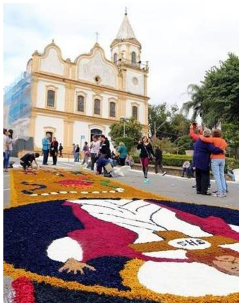
Corpus Christi em Santana de Parnaíba - SP

Este ano, são esperados 45 milhões de turistas nacionais no estado; um milhão a mais que em 2019, último ano antes da pandemia. O turismo internacional também cresce: 2,3 milhões de turistas estrangeiros, contra 2,1 milhões de 2019.