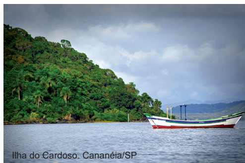
Ilha do Cardoso. Cananéia/SP

O Centro de Inteligência da Economia do Turismo, da Secretaria de Turismo do Estado de São Paulo, realizou em abril uma pesquisa com as prefeituras de 150 estâncias e municípios de interesse turístico para entender como as cidades têm se organizado neste momento e compartilhar as boas práticas, que poderão ser replicadas em outras regiões. O estudo levou em conta os dados de 201 entrevistas.